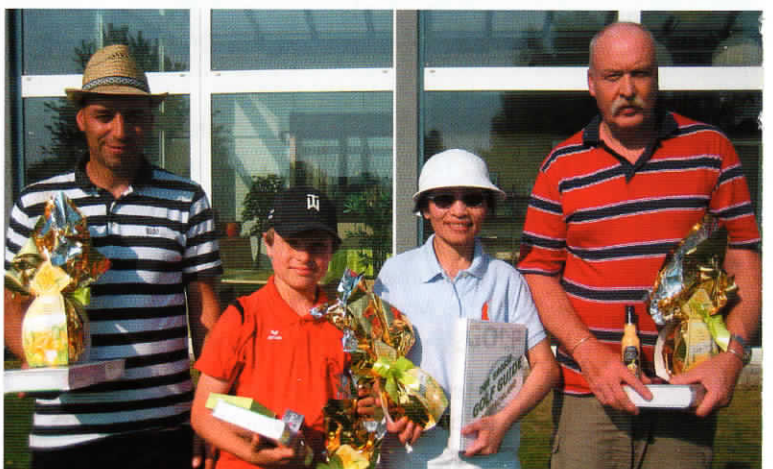
Sieger Ostereröffnungsturnier 2011

„Frühling lässt weiße Bälle wieder fliegen, na ja, zu Beginn der Saison wäre „flattern durch die Lüfte“ leider auch passend und „süße, wohlbekannte Düfte“ (in Form von Sonnencreme oder der Grillverpflegung) streifen ahnungsvoll das Land“.