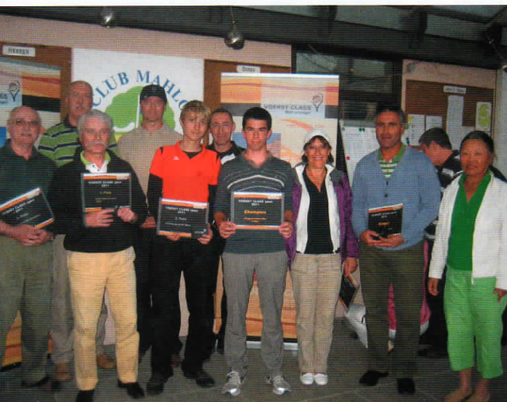
● Voerst Class Open