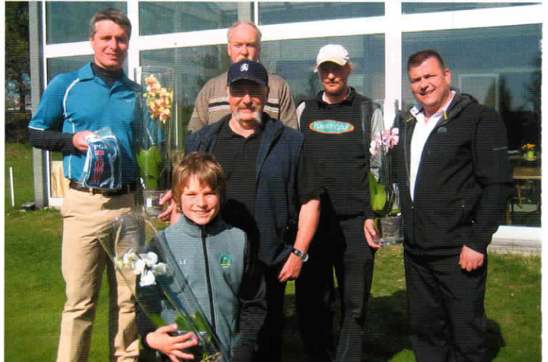
Sieger mit Keepers